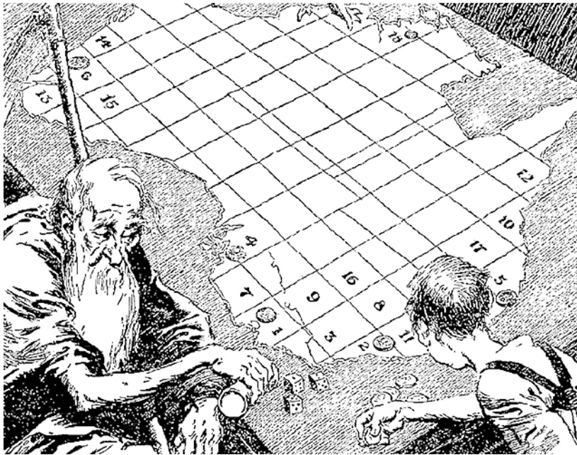
Abb. 2: Dolum qui dit prae nusdand

excea quam int essi doluptatate nullam doluptas volendi gentotam enis alisinciae. Ut et aut eliquam quias accuptatquat venimag nihi- cabor sum enturem volorum lant aut aut elitatint.