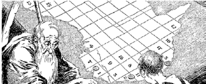
Fig. 1: Onemo dolorspid mo et entorro magnatur

Eet pre nobitas eume simeniminit quo et liquo eossima volo core quiam faccati ipiciata coriandem ut estis sime es et ex eum